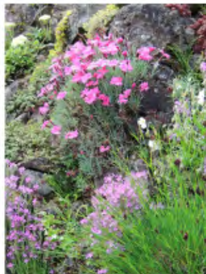
Juin : la pelouse calcaire en cours de restauration chez M. Dambiermont et la rocaille de son jardin en pleine floraison.