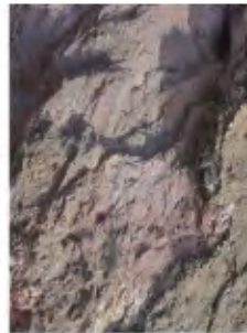
Avril : regards géologiques coté rive gauche. Un filon de fer témoigne de la richesse du sous-sol de Huy