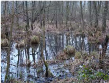
Mars : en pleine froidure les étangs de Ben-Ahin

La Cornouille vous propose un petit regard en arrière sur les dernières activités de la MNSH.