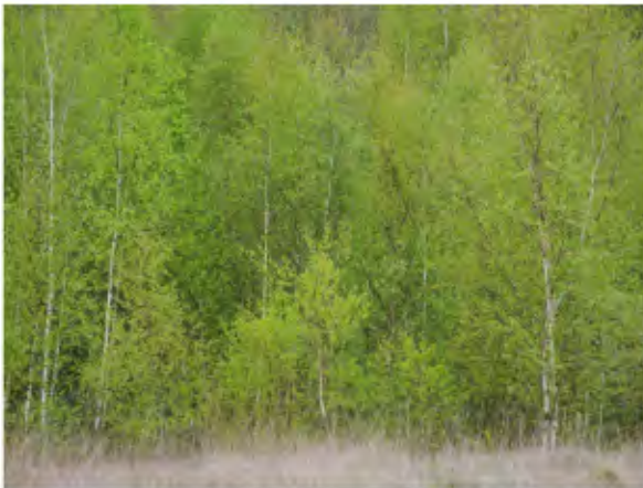
Mai: début de printemps sur les hauteurs de Corphalie